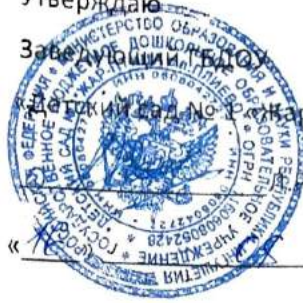
График проведения тренировочных занятий в ГБДОУ «Детский сад №1 «Жар-птица с.п. Плиево» при возникновении ЧС